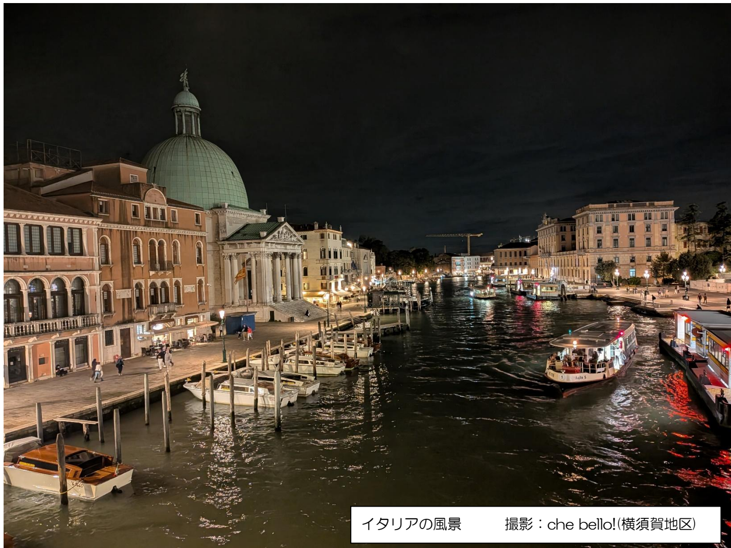
イタリアの風景 撮影：che bello!(横須賀地区)